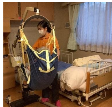
介護現場で働く 当社サポートの介護技能実習生

初任者研修から介護福祉士資格に必要な実務者研修までフォローし、外国人介護従事者の介護福祉士資格支援も可能です。